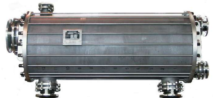
Graphit Ringnutkondensator HB7-12