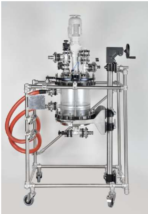
Schritt 1: Grundstellung mit Deckelplatte auf Bedienhöhe