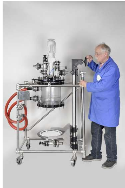
Schritt 6: Absenkung Boden mit Filterplatte ohne Glaszylinder