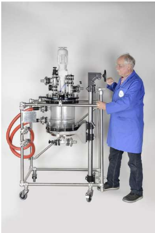
Schritt 3: Absenken Kompletteinheit für Handlochbefüllung