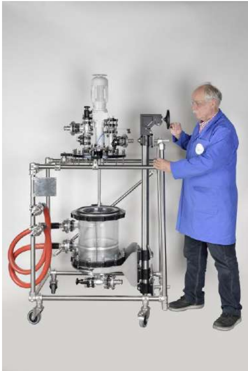
Schritt 5: Absenkung Boden mit Filterplatte und Glaszylinder