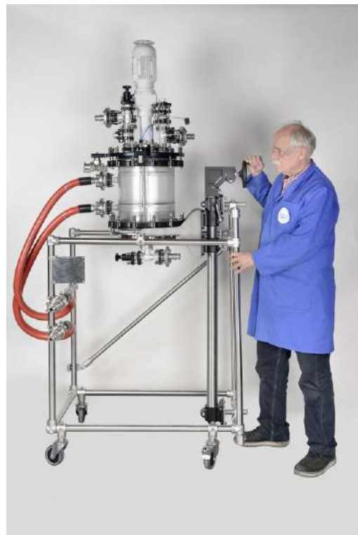
Schritt 4: Anheben Kompletteinheit für Abfluß ca. 1.000 mm